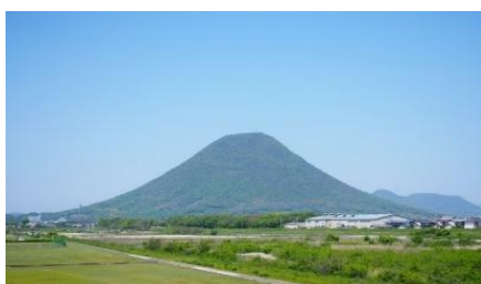
さぬき富士 香川のシンボル”さぬき富士” 農園の北側3 kmに位置します。