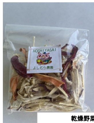
乾燥野菜 「大根(カラ-大根含む)」