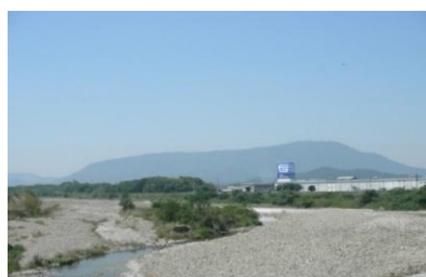
農園横の土器川 (香川県唯一の一級河川)「土器川」の 伏流水を栽培に用いています。