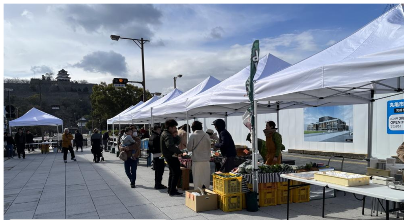
「丸亀城」 江戸時代より残る12天守のうちの一つ