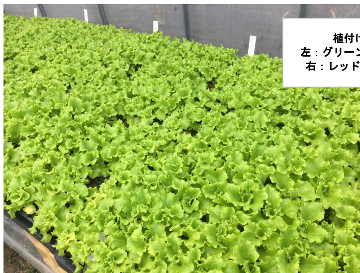
植付け前の苗 左: グリーンリーフレタス 右: レッドリーフレタス