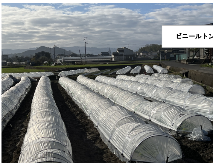
ビニールトンネル

※黒白印刷では微妙な色合いが分かりにくいかもしれません。お手数ですがInstagramでご覧いただければ幸いです。