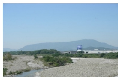
農園横の土器川 (香川県唯一の一級河川)「土器川」の 伏流水を栽培に用いています。