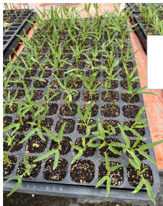
育苗 左: ヨウサイ(空心菜) 下: きゅうり