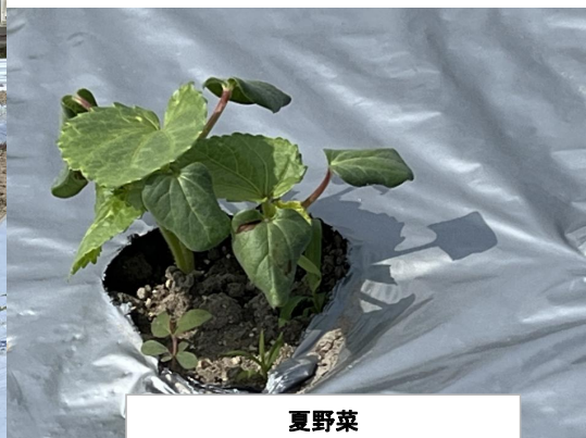
夏野菜 上: オクラ 下: ミニトマト