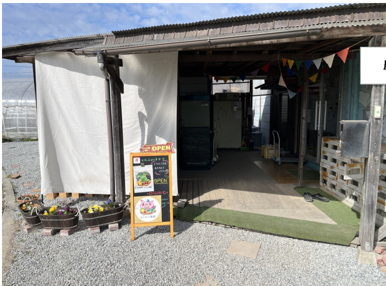
農園の入り口付近

♪お気軽にお寄りください。 ♪その日に収穫したお野菜をご提供出来ます。 ♪事前（1～2日前）にお電話を頂けるとご希望のお野菜をご準備できます。