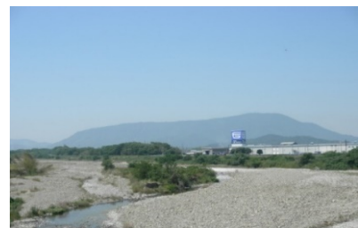
農園横の土器川 (香川県唯一の一級河川)「土器川」の 伏流水を栽培に用いています。