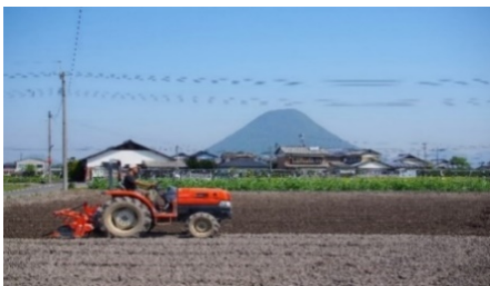
耕耘 ”さぬき富士”を背景に トラクター作業