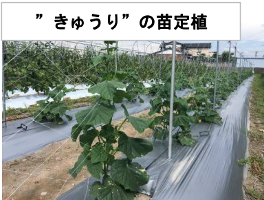
”きゅうり”の苗定植